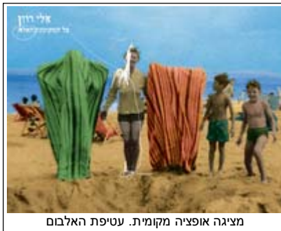
מצגה אופציה מקומית. עטיפת האלבום