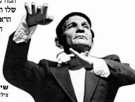
שייקה אופיר צילום: שמואל רחמני

ולמשהו שונה לגמרי. שייקה אופיר לא היה עוד דמות חשובה בתרבות הישראלית. הוא היה אחר היסודות, שסביבם יצקו פה הכול (כאמצעות חרא של פועלים. אבל זה לטור אחר). עכשיו יוצא מארז חדש, המורכב משלושה תקליטים שלו המופיעים בריסק בפעם הראשונה, וכוללים את מיטב המערכונים של אופיר לצד שירים שביצע בהפקות שונות. לשמוע ולהיאנח. איך היינו, איך יכולנו להיות ומה יצא בסוף. ©